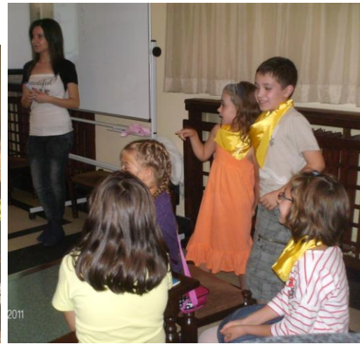
Отборите в действие