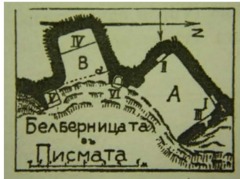
Фигура 1. Карта на Белберницата, местност Писмената

две пещери „Белберницата“: северната (А) е отворена към югоизток .... Южната част (В) е отворена към изток, с едно легло (IV) край задната и стена .... Пред входа в южната килия, от ляво, има един пизюл (V), а от дясно – една пейка (VI), сечена във вид на ниша, с една подпорка за крака.” (Шкорпил 1914: 146).