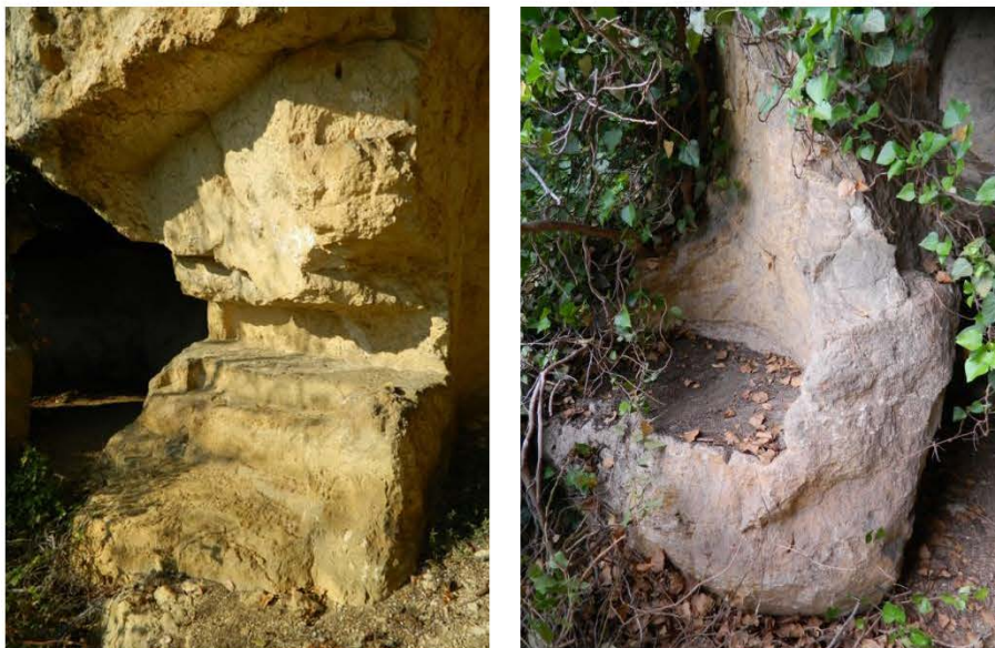
Фигура 3. Скално ложе за свети мощи и скален престол

оформеното скално ложе-алков, за свети мощи, в северозападната част на църквата, което за първи път бе описано от нас (фиг. 3). Изработено точно да осигури пространство за ракла със свети мощи, със старателно оформени „подпорка“, за удобство на коленичилите за молитва, над нея „первазче“ за полагане на ръцете на молещия се и с оформени от двете му страни издатини рамкиращи цялостно олкова. Установените в църквата два фрагмента от тънки керамични тухлички са допълнително свидетелство, че разглеждания скален храм не е от бедните и с незначителни храмове, а е един от богато изградените и с особено значение и място обители в района.