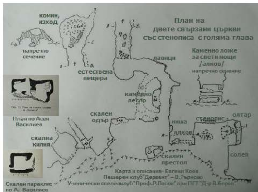
Фигура 2. План на двете свързани църкви със стенописа с голяма глава

Имайки предвид всички споменати неточности считаме за необходимо да се подчертае, че името „Белберница“ и „Берберница“ е използвано условно в заглавието на нашата работа, единствено за удобство и за ориентация на черпещите информация по темата. В същото време трябва да се направи уточнението, че разглежданата обител е не някоя друга, а именно основания от Св. Патриарх Йоаким I и неговите ученици, манастир Свето Преображение, каквито аргументи са посочени по-долу.