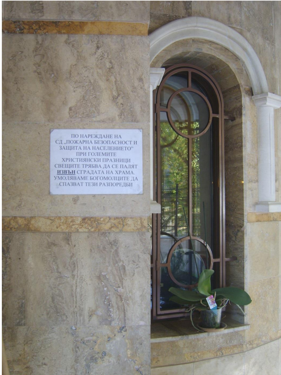
Фигура 2. Указателна табела в образец столичен храм. Тези надписи не разхубавяват свещените пространства, но издават отговорно отношение.