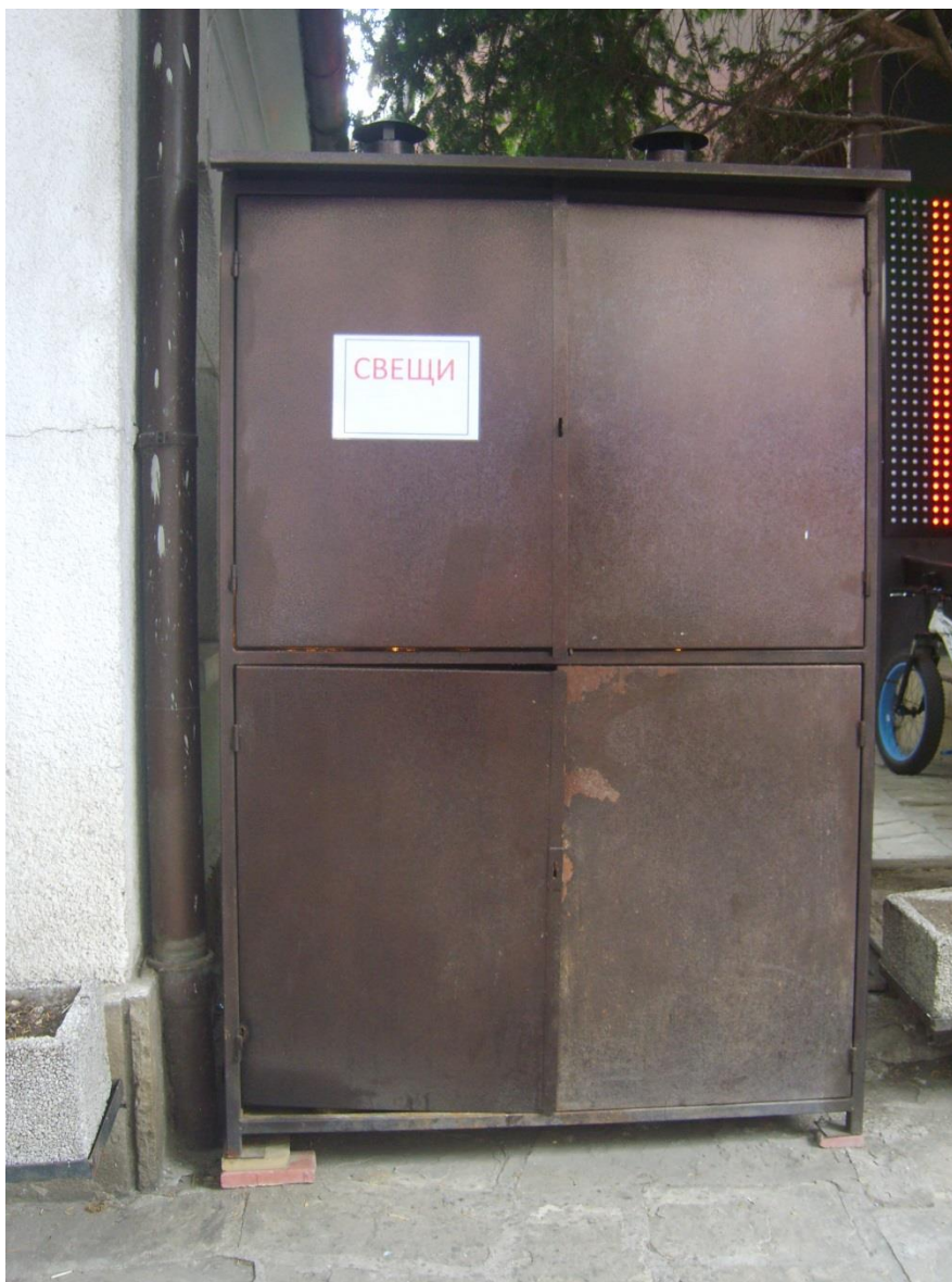
Фигура 1. Компактни и непожароопасни свещници, които още не са украсени и обозначени църковно и отвън, но вече позволяват на вярващите да виждат добре светите персонажи от реставрираните стенописи и икони, да отстояват цялото богослужение, без да се налага от време на време да излизат от свят на чист въздух и без да преодоляват стълбища за да запалят свещ на свещниците