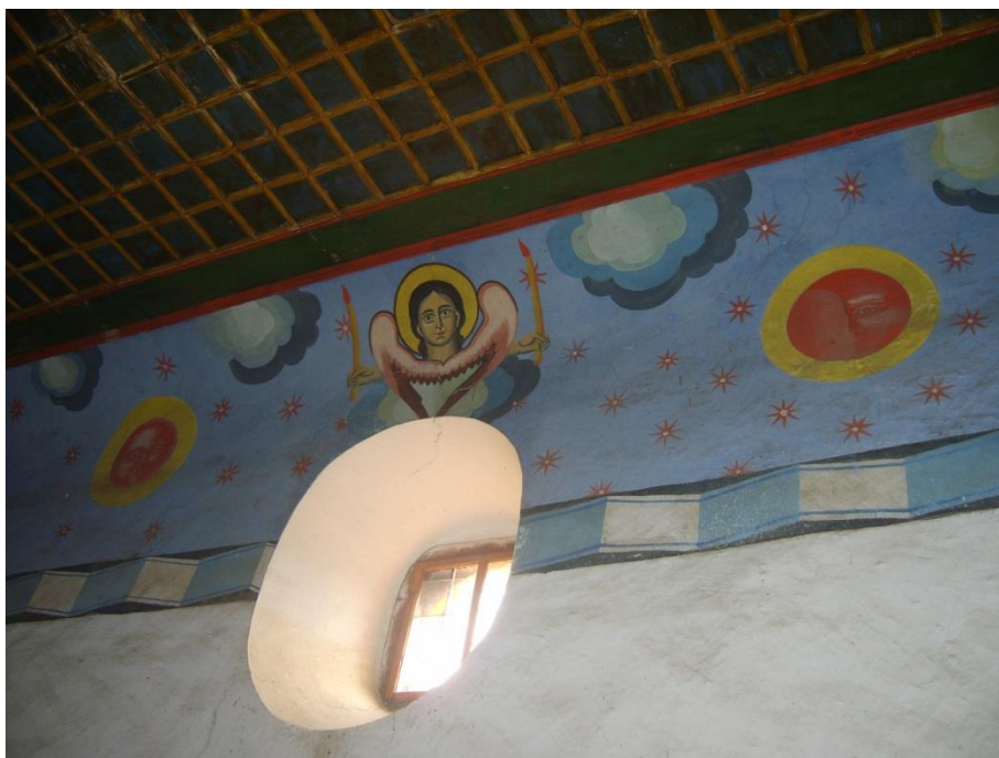
Фигура 3. Начините на изобразяване на невидимото присъствие на свещени персонажи и църковна общност в сакралните пространства никога не може да са свършени, както и възможностите на земните вярващи да участват в богослужението имат условности, особености и предели.