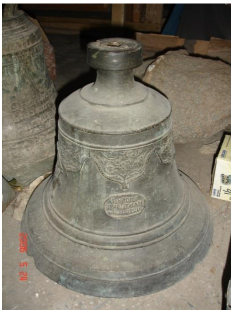
Фигура 6. Колокол храма Покрова Пресвятой Богородицы д. Турец Кореличского района, 1888 г.

частично сгнили, лестницы, ведущие к колоколам, в аварийном состоянии либо вообще отсутствуют. По причине этого описание колоколов нередко осуществлялось в довольно сложных условиях, часто без посторонней помощи и на высоте 5-10 метров от уровня пола колокольни. В некоторых случаях, дабы не рисковать жизнью, произвести измерения колоколов не удалось, но были сделаны цифровые фото campanов, надписи на которых расшифрованы нами позднее при обработке материала. Встречались и покрашенные масляной краской, побеленные вместе с потолком колокольни. В процессе работы выявлены некоторые ошибки в эксплуатации: подвешенные колокола соприкасались друг с другом, языки висели выше или ниже бойного кольца, использовалось два языка, колокол разбит, а в него продолжают звонить. На эти и другие проблемы при возможности обращалось внимание настоятелей, прихожан. По окончании экспедиций выслала архиепископу Артемию рекомендации по устранению недостатков.