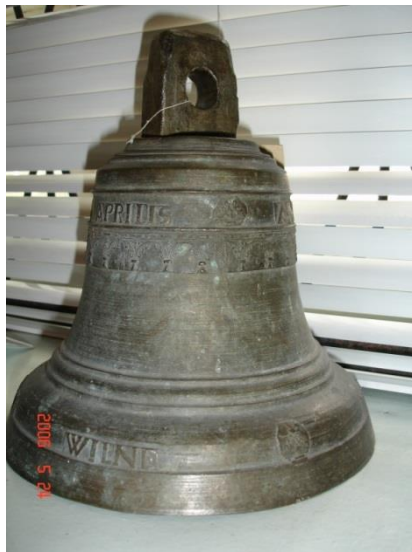
Фигура 3. Колокол с надписью «ANNO 1756 DIE 8 APRILIS FUDIT ME VANTONI APONOWICZ WILNE», Гродненский государственный музей истории религии, КП 7344

званную епархию входило девять уездов, в том числе Новогрудский, где в 51 храме значились кампаны весом от 5–10 фунтов до 40 пудов. Самый большой набор имелся в церкви св. Александра Невского с. Столовичи Новогрудского уезда, где значилось семь колоколов, из них 5 целых весом 40, 3, 2, 2, 1 пуд и два разбитых по полпуда. Наименьшее количество кампанов – по три в наборе. В двух описаниях имеются указания, кем пожертвованы. Так, в церкви д. Городище того же уезда отмечено, что 5-пудовый колокол «из отличного металла, художественно отчеканен и есть жертва Августейшей жертвовательницы ее Императорского Величества Государыни Императрицы Марии Александровны» 5 , а на другом колоколе весом 10 пудов из д. Дарево, кроме того, что пожертвован Деметрианом и Криштофом Кржывцами, указан год – 1675 6 . Составители предоставили краткую информацию о количестве и весе колоколов, их состоянии (целы или разбиты), местонахождении (на колокольне храма, в отдельно стоящей звоннице или колокольне, подвешены на столбе и др.).