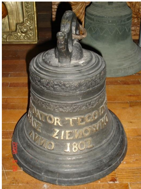
Фигура 4. Колокол с надписью «FUNDATOR TEGO DZWONA ELIASZ ZIENOWKO ANNO 1802», Гродненский государственный музей истории религии, КП 3018

В 1977 г. в г. Гродно был основан Республиканский музей атеизма и истории религии, позднее переименованный в УК "Гродненский государственный музей истории религии", в котором стали собирать колокола закрывавшихся храмов области. В нем сохраняется 16 колоколов XVIII – нач. XX вв. Именно музейными работниками этого учреждения в 1989 г. организована первая выставка колоколов «Звонкае рэха стагоддзяў». Кроме своих экспонатов для комплектования мероприятия использовались материалы из «частных коллекций, колокола из музея дневнобелорусской культуры АН БССР, музея общественной мысли Литвы, Сморгонского музея. Гродненский историко-археологический музей предоставил на выставку уникальные фрагменты колокола XII века» 7 .