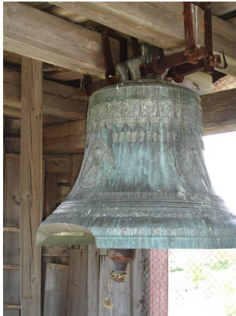
Фигура 7. Колокол с надписью «ANTONI TRAUTMAN W KALISZU ROKU 1908», Гродненский государственный музей истории религии, КП 3294

не имела на корпусе информации. По форме их корпуса можно предполагать, что они отлиты в XVIII-XIX вв. В этих колоколах были зафиксированы размеры в см (высота с ушами 9 , диаметр по низу юбки, высота без ушей или до сковороды) и сведения сохраняются в архиве автора. 40 колоколов XVIII – нач. XX вв., имели надписи, отлитые или вырезанные 10 по кругу колокола, иногда прерывавшиеся иконическими изображениями святых. 16 из них находится в УК «Гродненский государственный музей истории религии». Только датированные исторически ценные колокола внесены в таблицу, которая представлена ниже, там же представлены сведения о 8 утраченных инструментах.