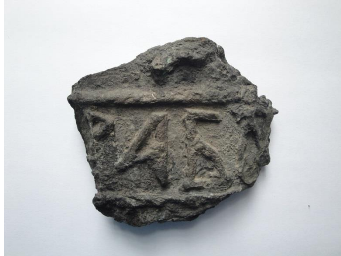
Фигура 1. Фрагмент колокола XII в. с надписью «РАБУ», обнаруженный при раскопках в г. Гродно

представлены бесформенными слитками расплаившегося металла» (вероятно, колокол был крупный. – Е. Ш.), «один из сохранившихся фрагментов весит 27,14 кг» [2] 2 .