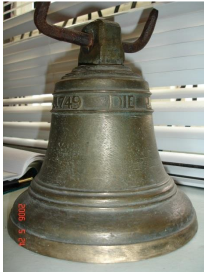
Фигура 2. Колокол с надписью «1749 PIEA 1BRIS ANNO», Гродненский государственный музей истории религии, КП 2086