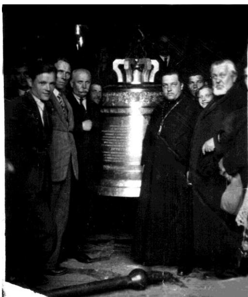
Фигура 10. Колокол из кафедрального собора Покрова Пресвятой Богородицы г. Гродно в день освящения, 1935 г.

Колокола перечислены в хронологическом порядке. Сведения о жертвователях взяты из рукописных источников либо зафиксированы автором с колоколов. В графах указаны год (век) отливки, местоположение и название храма, для которого предназначался колокол. В ряде случаев названы музеи, сохраняющие колокола в своих фондах.