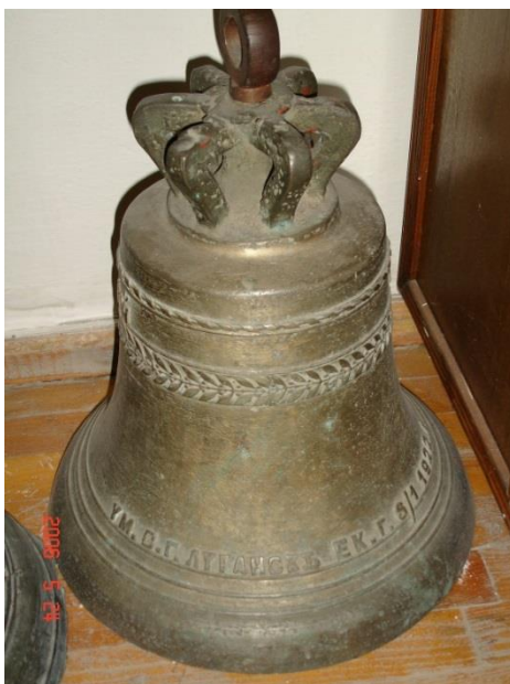
Фигура 9. Колокол с надписью «В ПАМЯТЬ Р.Б. ЮЛИИ NV ЛЕВИЦКОЙ ODLEWNIA DZWONOW F.LOTT m. DZIARSKLIS W PUSTELN. POD WARSZAWA UM В.Г. ЛУГАНСКЕ ЕКГ. 5/1 1922» Гродненский государст- венный музей истории религии, КП 1038

внимание Белорусской Православной церкви и Министерства культуры Республики Беларусь на необходимость более бережного отношения к историческим колоколам. Думается, что все они, являясь памятниками культуры белорусского народа, в случае невозможности реставрации и утраты своих утилитарных функций, могут быть собраны в первом республиканском музее церковных колоколов, с инициативой которого и выступает автор данной статьи. Забота о сохранении уникальных памятников духовного наследия народа – исторических колоколов – станет показателем уровня развития гражданского общества Беларуси.