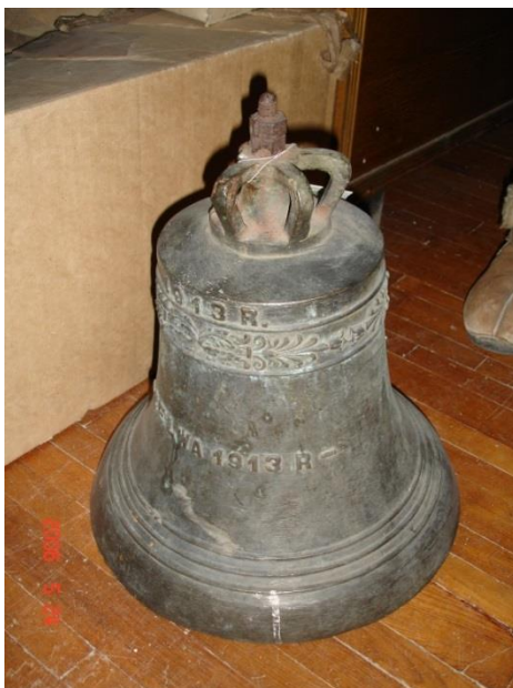
Фигура 8. Колокол с надписью «ZELWA 1913 R», Гродненский государственный музей истории религии, КП 4094

гг. в польских литейных (2 повреждены), 16 campanов с текстовыми надписями сохраняются в музеях 11 .