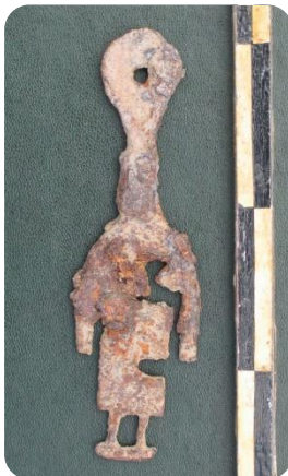
Фигура 2. Ключ от Великата лавра (преди консервацията)

Като елемент от заключващо устройство, ключът е сходен с известните екземпляри от Царевец, от Червен, както и от други райони на страната. Размерите му го поставят сред най-големите образци, което свидетелства и за характера и размерите на самото заключващо устройство. Поставен в него, той е действал чрез преплъзване. Изработката е от желязо чрез изковаване. Не само постигнатата обща форма, но и прецизно оформените секретни елементи на сложния затварящ код, издават високите технологични умения на майстора.