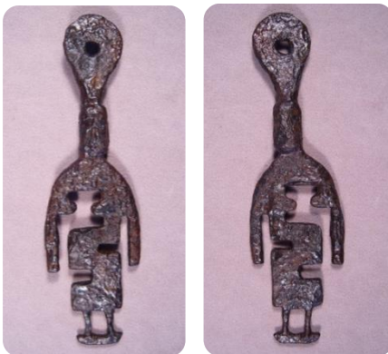
Фигура 3. Лице и опакo на ключа (след консервацията)

Общият силует на ключа представлява двуизмерна пластична творба. Изобразена е изправена човешка фигура, в правилни пропорции, като двете ръце са встрани, отпуснати по протежение на тялото (Фиг.3).