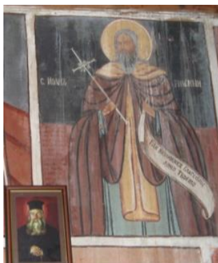
Фигура 2. Стенопис в народен стил в Кладнишкия манастир „Свети Николай Мирликийски“, от края на XIX век, от Коста Антикаров