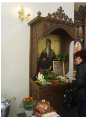
Фигура 7. Молитва пред проскинитария с печатната синодална икона на светеца в северната част на църквата „Рождество Христово“ в София