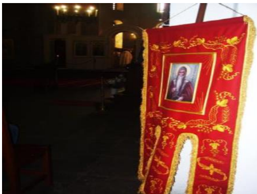
Фигура 6. Хоругвата на великотърновските поклонници на вечерното богослужение в църквата „Света София-Премъдрост Божия“ в София в навечерието на сборния поклоннически ден 1 август 2017 г.