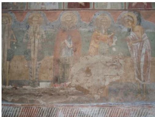
Фигура 1. Стенописи от XVI век на северната стена в притвора на църквата на Сеславския манастир „Свети Николай Мирликийски“. Свети Йоан Рилски е изобразен сред големите светии-пустинници

2 Изследовател на свободна практика, София, България