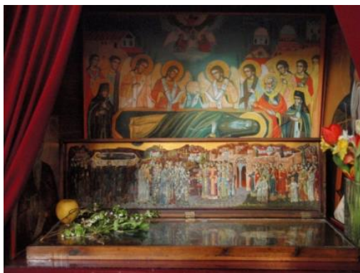
Фигура 5. Молитвеният кът в учебния храм на Софийската духовна семинария с мощехранителницата с иконите на Пренасянето на мощите и Успението и още няколко образа на свети Йоан Рилски