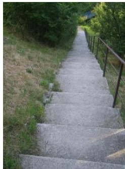
Фиг. 2. Стълбища на отиване на сбора на старата църква на кв. Вердикал, Баня, изградена на баир, в близост до спирка на редовен градски транспорт

Местните хора познават народния културен календар и с радост посещават веднъж в годината околните свети места в деня на техните храмови празници, когато е сигурно, че църквите ще са отворени.