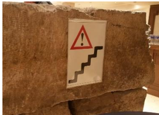
Фиг. 8. Обозначаване на социализираната в хотел част от останките от амфитеатъра на Сердика

Дарствените надписи от фиг. 7 напомнят за необходимостта да се създават удобства за върволицата поклонници обикалящи манастирите край столицата.