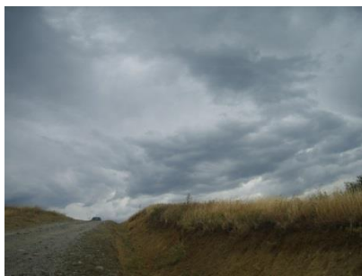
Фиг. 1. Пътят на връщане от сбора на Бистришки манастир „Свети богоотци Йоаким и Анна“

Сайт и галерия с фотографии на управата и посетители, създадени от тях и представящи дейности, мисия, визия; обогатяване с репортажи от различни събития, по-често от няколко пъти годишно; разрешение информацията да се допълва, ползва и разпространява; езикови, акустични, визуални и перформативни (ритуални) подобрения на богослужението, видеостена, изкуства, декорация, хигиена; дигитализиране с еднакво внимание към ценни стари документи и икони, богослужебни и поклоннически детайл, сезонна флора и фауна; проследяване как растат децата и живеят младежите, как работят и общуват възрастните; споделяне на граждански успехи и признания, рекреативни и развлекателни дейности и инициативи; уважаване на благотворителност, придобивки за мястото и хората; системно архивирание на информацията на стабилни носители в различни и реномирани локации и с добра техника; покани към водещи експерти и местни общественици и творци, колективи или прицърковни клубове, съвместни изяви, участие във форуми, представяния, експозиции, кампании, фестивали, проучвания и публикуване на данните за местното живо и материално наследство