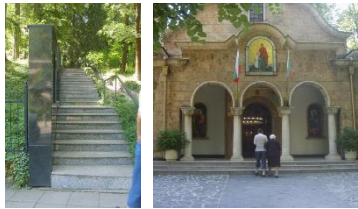
Фиг. 5. Плавен подстъп към портите на пъстрия планински Клисурски манастир „Св. Петка“