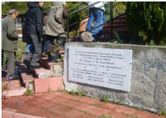
Фиг. 7. Стълбища посрещат навсякъде непрестанния туристически поток

пътеки, които водят към отделни кътове, обособени в градината