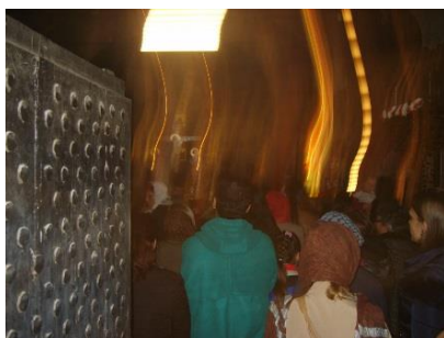
Фигура 9. Контакта на прякото дигитално възприемане с висшите религиозни идеи намира и мистични обяснения