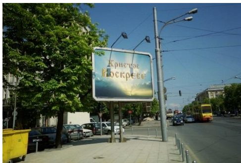
Фигура 1. Празничен билборд в София издържан в православно и протестантска стилистика