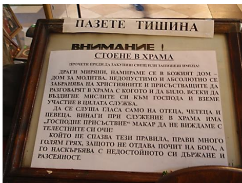
Фигура 4. Табели до входа, където традиционно се изобразява Свети архангел Михаил със свитък, изискващ благоговейно влизане в храма