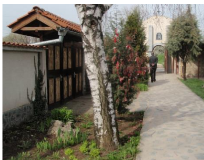
Фигура 7. Апел към изповедничество и добротворство от страна на поклонниците (изразяващо се в съблюдаване на дрескод)