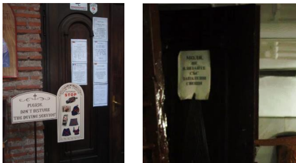
Фигура 6. Врата към храм отрупана с ограничителни надписи за туристите на различни езици с молба да не се носят запалени свещи по време на молитва