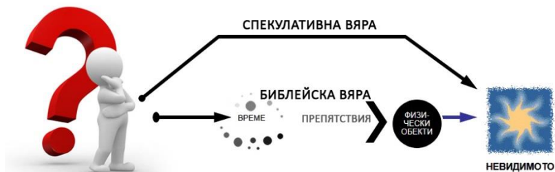
Фиг. 1. Истинска и спекулативна вяра

Нека се обърнем и към старогръцкия текст: Εστιν δε πιστις ἐπιζομενων υποστασις, πραγματος ελεγχος ου βλεπομεν ων . Етимологията на даденото в Евреи определение на вярата, υποστασις (увереност), дава няколко значения: същност, действителност, основа, увереност, надежда, гаранция, вкл. удостоверяване в документи, свидетелстващи за притежание (Kleon, 2001: р. 828). В папирусите думата ελεγχος означава доказателство в съда, което подкрепя обвинението. Като използваме този превод на отделните думи, ще предложим следното определение за вярата: вярата е действителност на нещата, които очакваме, увереност в дела, които не се виждат . Според това тълкуване вярата не е осъществяване на човешко желание, а твърда увереност в невидимото от една страна, в неща, които могат да станат видими скоро или след време според Божията воля, но, от друга страна е и увереност в неща, които могат да се осъществят само във вечността. Следователно вярата действа в духовният свят и в материалния (вж. фиг. 2), като се развива едновременно в няколко