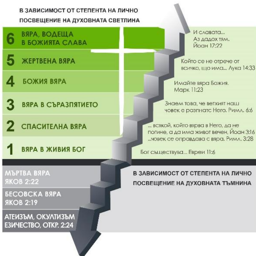
Фиг. 3. От вяра към вяра (авторска схема)

Живот по плът и живот по дух. Изначалната двуизмерност на вярата обуславя разграничението между “дела на плътта” и “плодове на духа”, както и “живот по плът” и “живот по дух”. Историята на Църквата е богата с герои на вярата, чиято вяра е била благословение за редица народи. Те, както и Авраам, са полагали много труд и усилия, за да постъпват не по плът, а по дух. Вярата в спасението, в съразпятието, жертвена вяра и вяра, която въвежда в Божията слава са части от дългия процес на живота по дух (фиг. 3). Здравата вяра не е статична, тя се развива, при това стъпаловидно. Това е показано схематично като стълба, за която ползваме библейския модел на стълбата-вяра от видението на Яков и описваме детайлно в следващите страници.