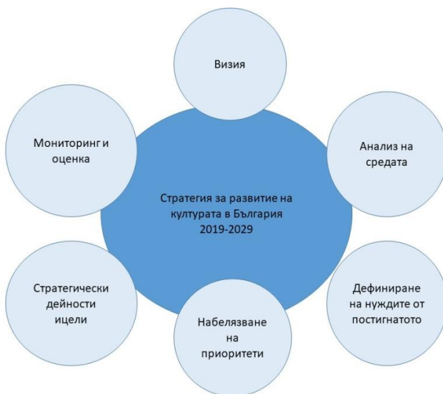
Фиг.1. Стратегия за развитие на културата 2019-2029

В процеса на изграждане на стратегията се обособяват няколко взаимосвързани етапа, които дефинират проблема, анализират средата, формулират потенциални решения. Фигура 1 представя визията на стратегията за развитие на българската култура, разработена на анализ на предходния 10 годишен период и със значение на стратегически документ за следващите 10 години.