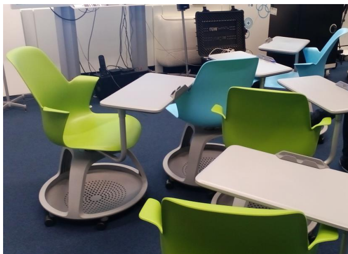
Фиг. 7. Столчетата са на колелца.

Столчетата също са на колелца. Оборудвани са с масичка за писане и с място за поставяне на личен багаж, и дават възможност за придвижване между различните зони (фиг. 7).