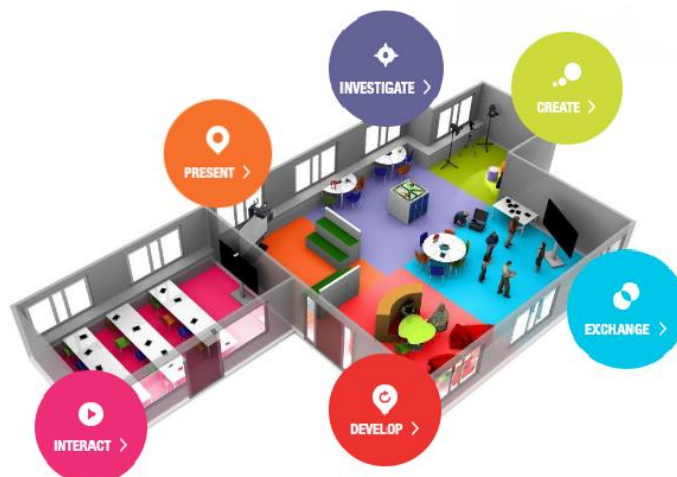
Фиг. 4. План на Класната стая на бъдещето.

Класната стая на бъдещето представлява примерен STEM център, разположен в централата на Европейската училищна мрежа в Брюксел (Future Classroom Lab, n. d.). В него редовно се провеждат семинари и обучителни курсове за учители. Посещението на този STEM център е вдъхновило много учители да преоборудват класните си стаи и да променят подходите си на преподаване.