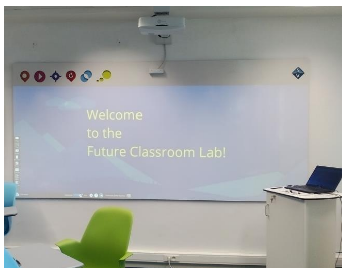
Фиг. 5. Интерактивна дъска с тъч скрийн.

Класната стая на бъдещето е оборудвана с роботи, дигитални лаборатории, 3D режещи плотери, различни котролери, интерактивни дъски, като едната от тях е с тъч скрийн (фиг. 5), смарт телевизори с връзка с Интернет, лаптопи, таблети и др.