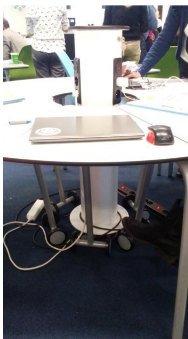
Фиг. 6. Маси на колелца. В средата колона за зареждане на устройства.

За да могат бързо и лесно да се променят пространствата, масите са на колелца, с възможност да се подреждат около колона за зареждане на устройства (фиг. 6).